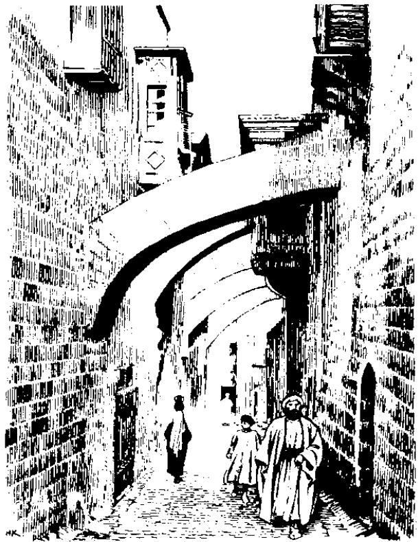
Ralan do hilo'd bandar do Yorusalim (5.1)

5 Om id tohuri noddi ko' iri om haro o tatau'd agayo do tulun do Yohudi, om ongoi noddi i Yesus do hilo'd Yorusalim. 2 Hilo' nopod Yorusalim om haro o tiso' o kulam dit id somok' di wawayaan di roitan do "Wawayaan do Dumba'", i pinungaranan do Baitisda k dot id suang do boros dot Ibrani. Om hiri nopoddi nga' haro o limo nokoiyonon do tinaapan. 3 Om hiri nopod tinaapan diri nga' ogumu' o tulun do sumakit