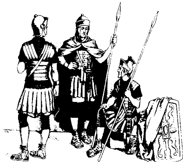
Soudor do Rum (19.2)

6 Om soira'ddi nokito di piro-piro boyoon dot imam om i madtatamong i Yesus, om pomogiak no iyolo' do,