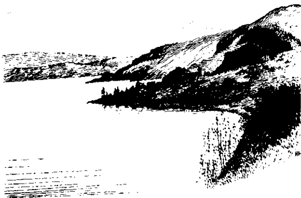
Tasik Galilia (6.1)