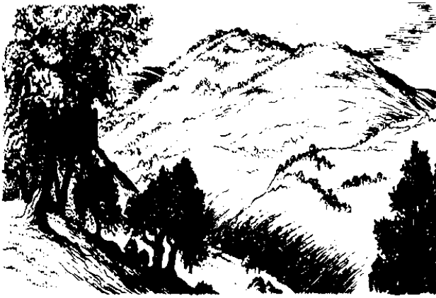
Nulu-nulu do Saitun (8.1)

do poingkaa, “Guru, iti nopo tondu'dti om nokosupan do magampahu'. 5 Om id suang nopod Tourat om minonuhu' i Musa do momodumpau do watu do tondu' do miagal diti do gisom dot apatai iyau. Om poingkuro o diya'd tosorou, oi Guru?” ka diyolo'. 6 Om minuhot pogi' iyolo' do miagal diri nga' pomurunsut daa diyolo' di Yesus, om haro indo o ralan diyolo' do papasala' dau. Nga' tudu' nopo i Yesus om ponulis no iyau do hiri'd tana' do tunturu' dau o pinonulis. 7 Tontok dit onsonsog kopio iyolo', om hangog no iyau om boro-boros nod, “Isai nopo o tulun dit aiso' o dusa dot id pogialatan dokoyu, om iri no mogulu do momodumpau'd watu diti tondu'dti,” ka dau. 8 Om tudu' noddid kawagu i Yesus, om pintulis no do hiri'd tana'. 9 Om korongou poddi diyolo' i boros di Yesus do miagal diri om tongkiad no iyolo' do mantad hiri, do soroiso-iso' iyolo' do tuminongkiad, do minogulu nopo om i molohing no kopio. Om alaid noddid om iso' po i Yesus do hiri om poingkakat kasai' po i tondu' do hiri'd pinoingkakatan dau. 10 Om hangog noddid i Yesus om boro-boros no dot id tondu'ddi, “Honggo ngai' no iyolo'ddi? Aiso' i' o tiso' diyolo' do minomohukum diya'?” ka.