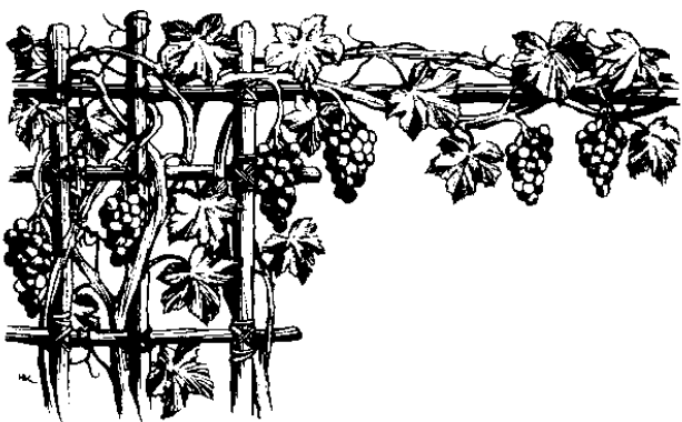
Raan dot anggur (15.2)

15 Om boros ka kawagu di Yesus, "Iyoho' no o miagal do guas dot anggur dit otopot kopio, om i Tapa' ku o gompomogompi' di guas dot anggur. 2 Pointikid-tikid do raan dit a' mongua', om tutuon no dau, om pointikid-tikid do raan di mongua' om piralapan dau o roun, om pillanggaan dau i raan om sumapou