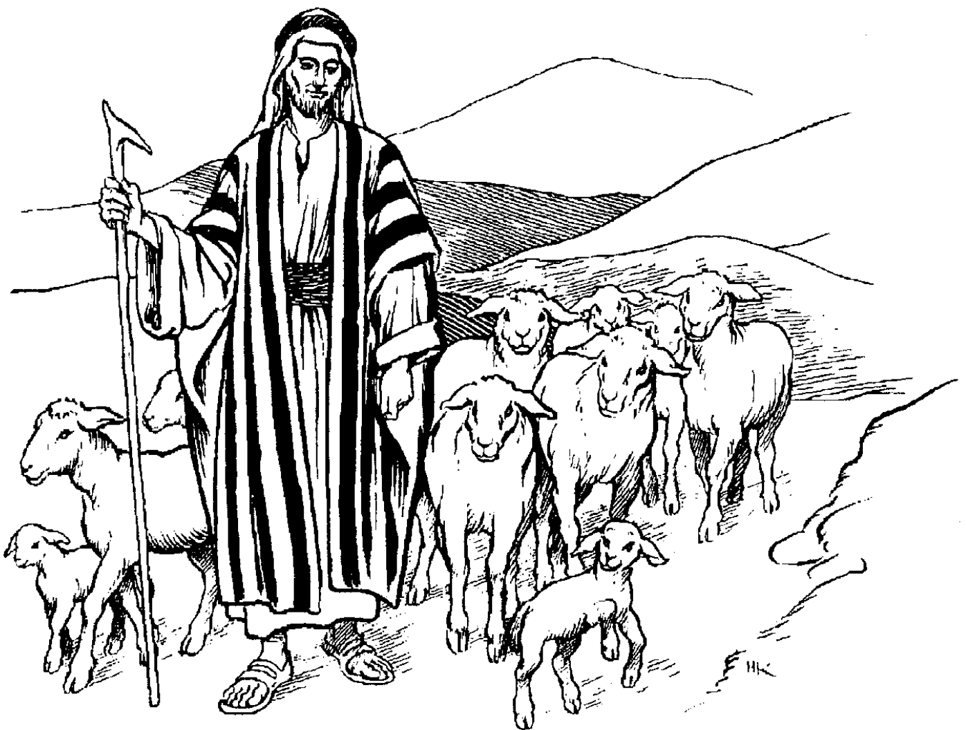
Sahzòq-k'èdì-dɔ̀ nezɿ (10.11)

11 "Sɿ sahzòq-k'èdì-dɔ̀ nezɿ aht'e. Sahzòq-k'èdì-dɔ̀ nezɿ sɿ edesahzòq gha eɫàawɿ hɔ̀t'e. 12 Sahzòq-k'èdì-dɔ̀ gha eghàlaedaa sɿ sahzòq-k'èdì-dɔ̀ elɿ nìle, xàè wets'ò sahzòq agɿt'e-le t'à. Eyit'à dìga